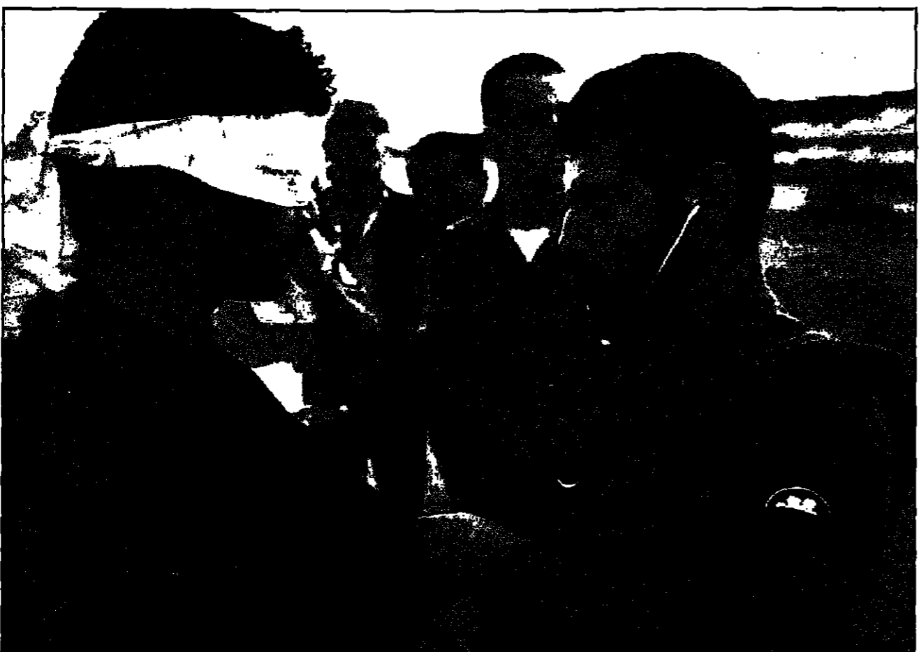
اييب اسراييلي عسكري يخلص سجيناً فلسطينياً قبل اطلاق سراحه أمس الأول

رايين رفض مقايضة مؤسس حماس بجندي اسراييلي القدس- رويترز- قال والد جندي اسراييلي ان رئيس الوزراء الراحل اسحق رابين رفض ادائه لمقايضة الشبح احمد ياسين مؤسس حركة حماس الاسلامية للشهيد الذي خطف في عام 1994. وعاد ياسين الى قطاع غزة امس الاول بعد ان افرجت اسراييل عنه الاسبوع الماضي. وكان الشيخ اللقمة رفضي نقلة السجن مدى الحياة في اسراييل عندما صعدت عنه في اطار صفقة مقايضة عميلين اسراييليين قاما بمحاولة اغتيال رئيس الوزراء الاسرائيلي اسحاق رابين.